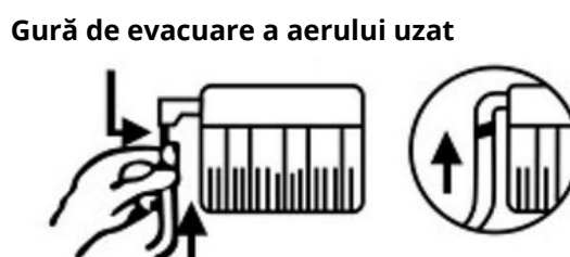
Conectați tubul de evacuare