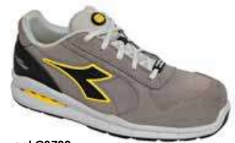
col.C8700 wind grey/wind grey