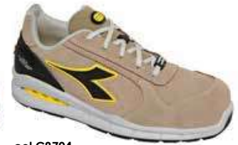
col.C8704 moon rock grey/moon rock grey