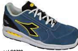
col.C8702 blue cosmos/blue cosmos