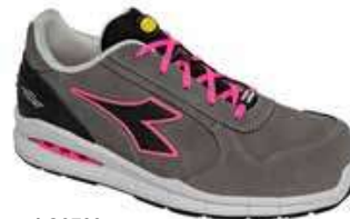
col.C8708 smoke/smoke sizes 35/42