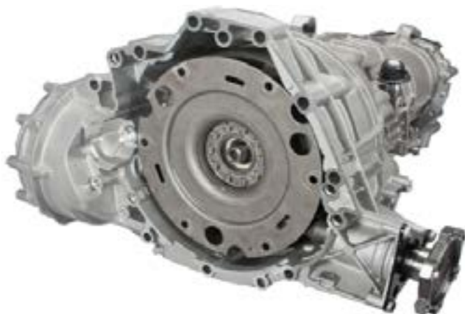
Fig. 1: Cutia de viteze cu modulul ambreiaj montat

Autovehiculele enumerate mai sus folosesc un modul de ambreiaj. Acesta cuprinde placa de presiune, discul de ambreiaj și o volantă cu masă dublă (DMF) cu o placă de antrenare. Modulul este plasat în carcasa cutiei de viteze înainte de montarea cutiei de viteze (Fig. 1) și apoi este fixat, ca un convertizor de cuplu, pe placa de antrenare a motorului.