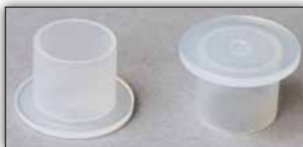
Fig. 2: Garnituri temporare

Pentru a preveni scurgerile de ulei în timpul procesului de demontare și înlocuire a cutiei de viteze, fiecare set LuK DMF și LuK RepSet®2CT este prevăzut cu două garnituri de etanșare temporare. Aceste garnituri se utilizează în momentul montării cutiei de viteze; acestea înlocuiesc garniturile de aerisire de culoare neagră ce se regăsesc pe unitatea mecatronică și pe cutia de viteze (vezi Fig. 1). După montare, înlocuiți ambele garnituri temporare cu cele permanente.