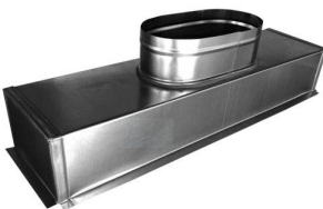
Cutie plenum executie speciala - racord ovalizat. Se realizeaza in situatiile in care dimensiunea grilei este mai mica decat cea a racordului la tubulatura, iar spatiul nu permite executia unui plenum evazat.