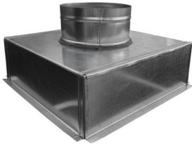
Cutie plenum standard cu racord axial.