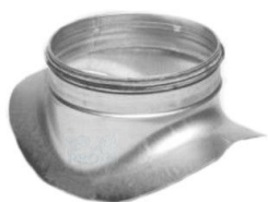
Piesa racord tip sa presata