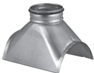
Piesa racord tip sa faltuita