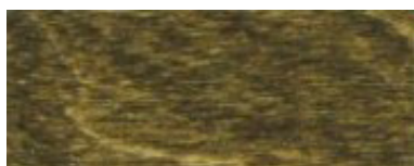
Eiche antik / Stejar antic (483)