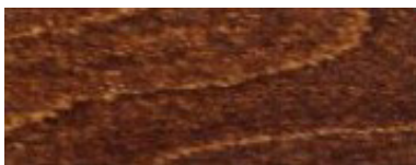
Palisander / Palisandru (487)