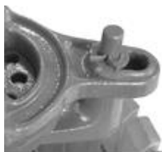
Slika 7. (položaj A)