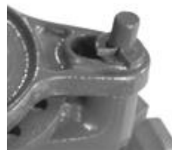
Slika 7- (položaj B)

9. Ubacite metalne klinove (2) u otvore na pokretnom držacu tako da vrhovi klinova upadnu u rupe koje se nalaze na donjoj unutrašnjoj ploči pokretnog držaca. Gornji vrhovi klinova moraju biti okrenuti u smeru kazaljke na satu (suprotno jedan u odnosu na drugi) – Slika 6 .