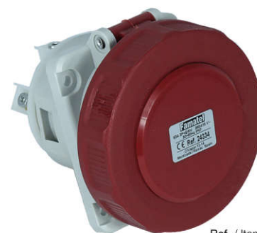
Ref. / Item 24334