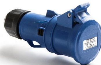
Ref. / Item 23200