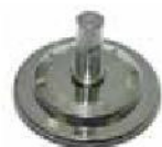
Micro Base (Recommended) (XX045CR-0095)