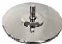
Large Base (XP050CR-0090)