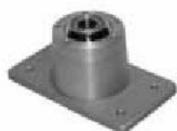
Ball Mount (XX045CR-0014BALL)