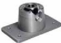
Vaulted Ball Mount (XX045CR-0015BALL)