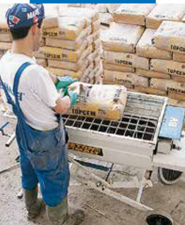
Realizarea amestecului Topcem cu malaxor orizontal avand ax spiralat