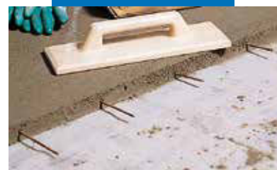
Detaliu sapa cu Topcem