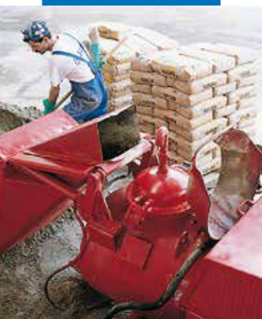
Realizarea amestecului Topcem cu o pompa automata cu presiune