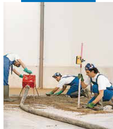
Aplicarea si nivelarea mortarului de Topcem