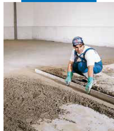
Realizarea fasilor de ghidaj si nivel