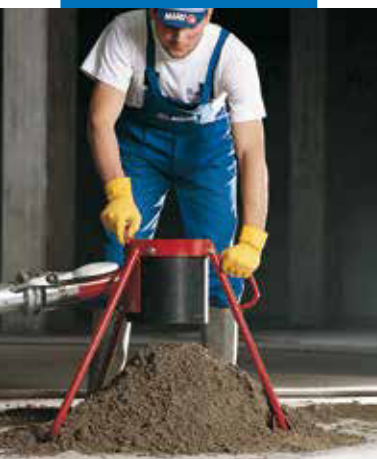
Alimentarea cu amestec Topcem