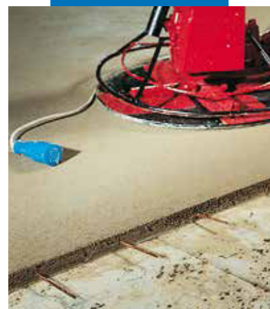
Finisarea suprafetei sapei Topcem cu un elicopter