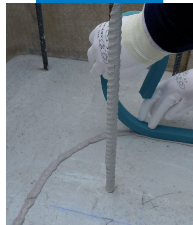
Aplicarea Idrostop Soft pe suprafețe orizontale

Toate referințele relevante despre acest produs sunt disponibile la cerere sau pe www.mapei.ro